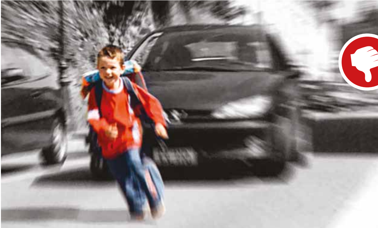
Le comportement de l'enfant peut être imprévisible.